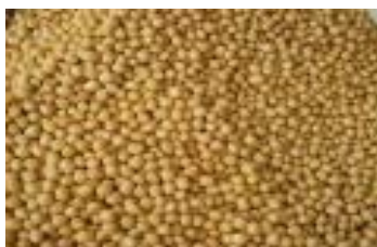
graine de vouandzou

Voandzou (Gadianga en wolof) : Le voandzou est largement cultivée pour ses graines ressemblant à des haricots et récoltées sous terre à l'instar des arachides. Les graines de voandzou sont consommées bouillies ou frites. Elles servent aussi à confectionner des galettes et des beignets et sont plus savoureuses avant la maturité complète.